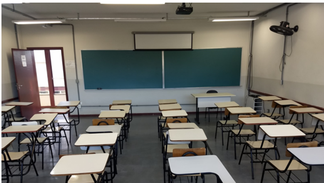
Figura 3 – Foto de uma das salas de aula do curso de Inteligência Artificial.

O instituto conta com 25 salas de aula cuja capacidade varia entre 34 a 60 alunos. Todas as salas são equipadas com um Datashow, um computador e ventiladores. Todas as salas são faxinadas diariamente pelo setor de limpeza do ICEA. A Figura 3 contém uma foto de uma das salas de aula do curso de Inteligência Artificial.