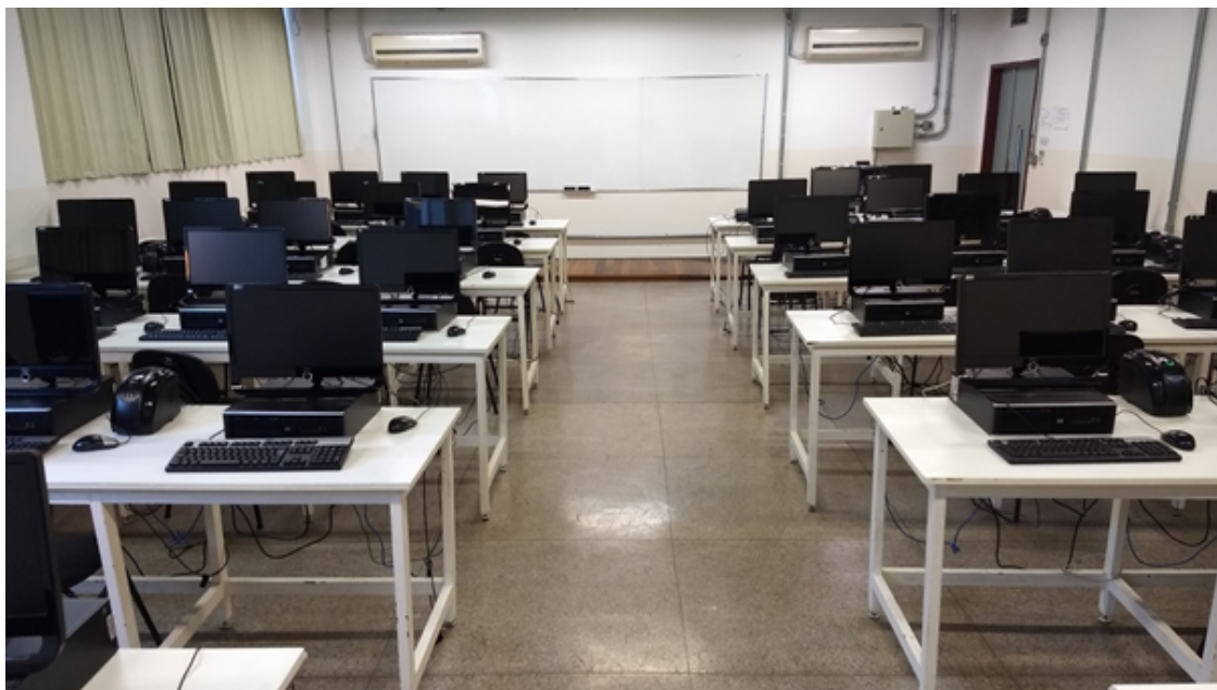
Figura 4 – Foto de um dos laboratórios de ensino do curso de Inteligência Artificial.

Os laboratórios de ensino atendem às necessidades básicas e específicas do curso, sendo gerenciado por um coordenador, indicado pela unidade, que é responsável por fazer cumprir as normas de funcionamento, utilização e segurança do local. O coordenador é responsável também por verificar e solicitar a manutenção periódica dos equipamentos e, indicar a necessidade de atualização e garantia dos recursos mínimos para a o desenvolvimento adequado das atividades dos laboratórios. A Figura 4 apresenta a foto de um dos laboratórios de ensino do curso.