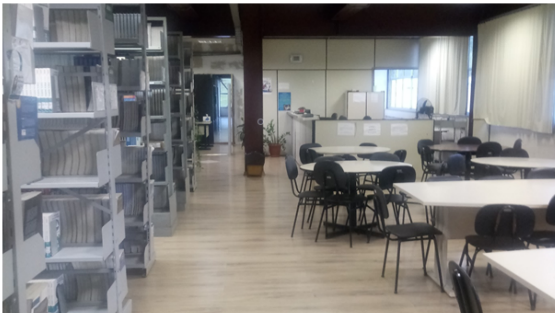
Figura 7 – Foto da biblioteca setorial do ICEA.

O campus do ICEA, onde o curso de Inteligência Artificial está inserido, conta com uma biblioteca setorial física. A biblioteca do ICEA funciona das 8:00hs às 21:00hs horas e conta com cinco técnicos administrativos, sendo uma bibliotecária e quatro auxiliares de biblioteca. Seu acervo 1 é de 3.026 títulos, 11.321 exemplares, e mais de 31 mil títulos e-books . A biblioteca possui um espaço para consultas no local, com aproximadamente 80 assentos. A Figura 7 apresenta uma foto da biblioteca setorial do ICEA.