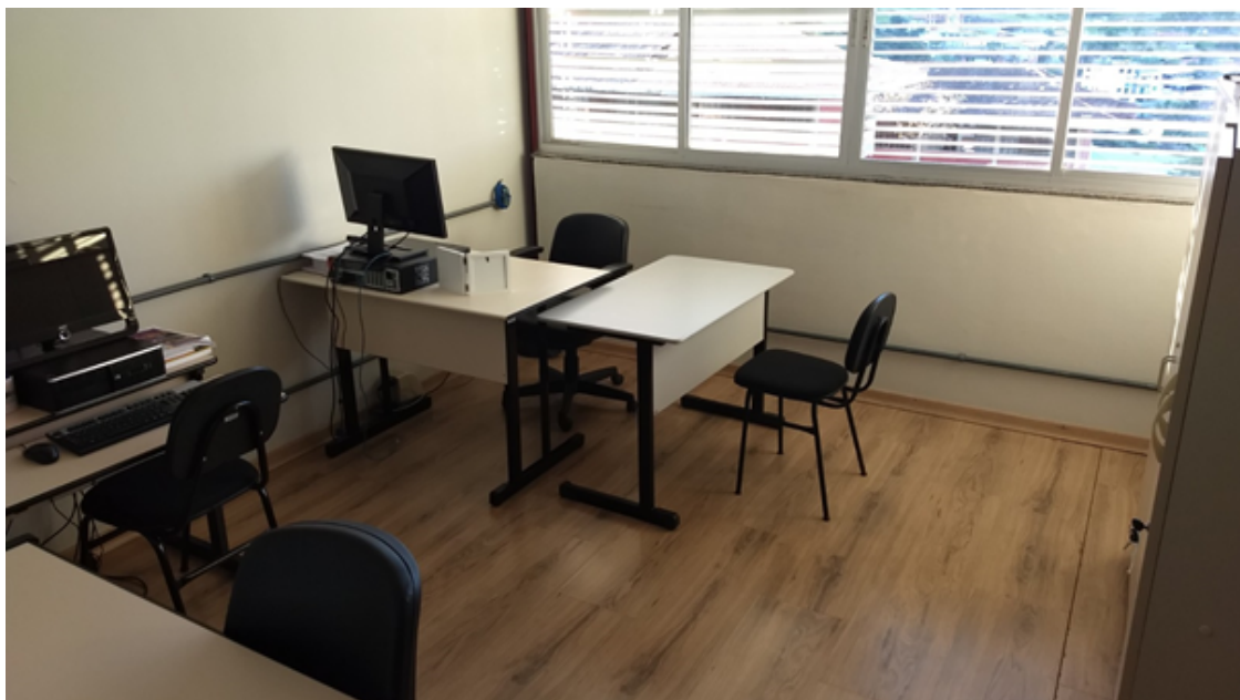
Figura 2 – Foto de uma das salas dos professores.