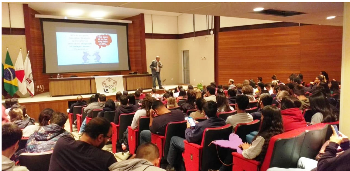
Figura 6 – Foto do auditório do ICEA.